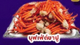
บุฟเฟ่ต์ขาปู