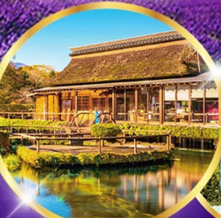
หมู่บ้านโอชิโนะ อักโ