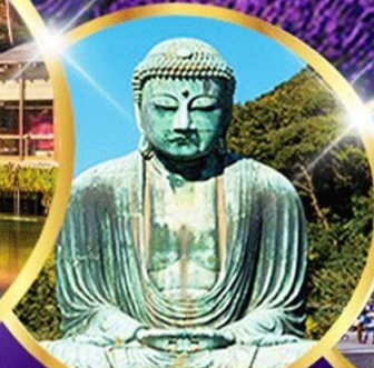
พระใหญ่โตบุทสึ